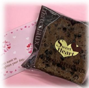
⑥ パウンドケーキ (ココア) ¥200 賞味期限 8日程度