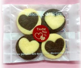
① ハートクッキー ¥130