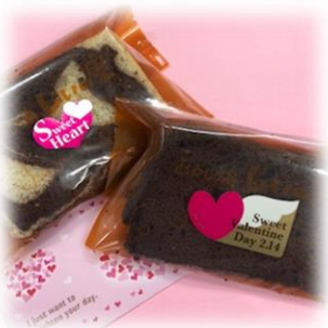
⑤ シフォンケーキ (マープル・ココア) 各¥200 賞味期限 当日～翌日