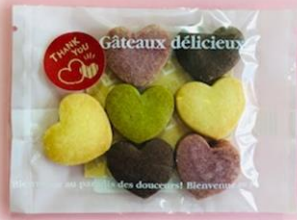
② ラブちゃん ¥130