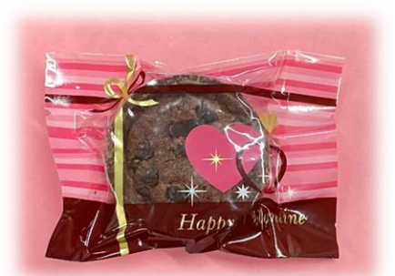
⑦ ココアタルト(チョコチップ入り) ¥200 賞味期限 8日程度 数量限定

※ 通常5営業日前の受付とさせて頂いておりますが、ご注文状況により、ご希望に添えない場合がございます。ご了承下さい。※数が多い場合は、特にお早目にご注文下さい。