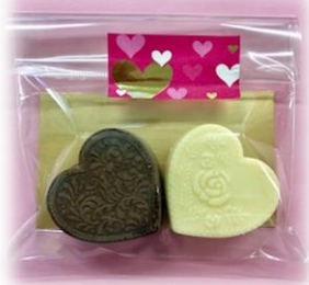
④ ラブリーチョコ ¥300 (クッキーサンド)