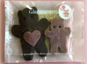
③ ベアーちゃん ¥130