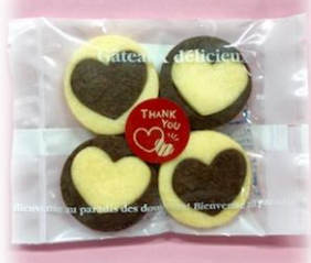
① ハートクッキー ¥130