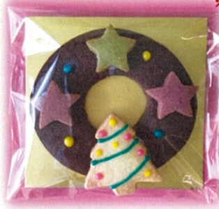
クリスマスリース(プレーン・ココア) ¥400 (10 cm×10 cm) ※店頭販売にてお持ち帰りのみ