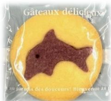
いるかくん (むらさきも)