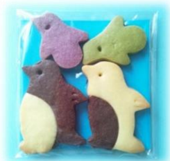
ペンギンファミリー ¥300