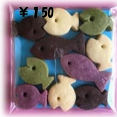
おさかなファミリー ¥300