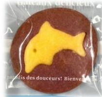
いるかくん (ブルー)